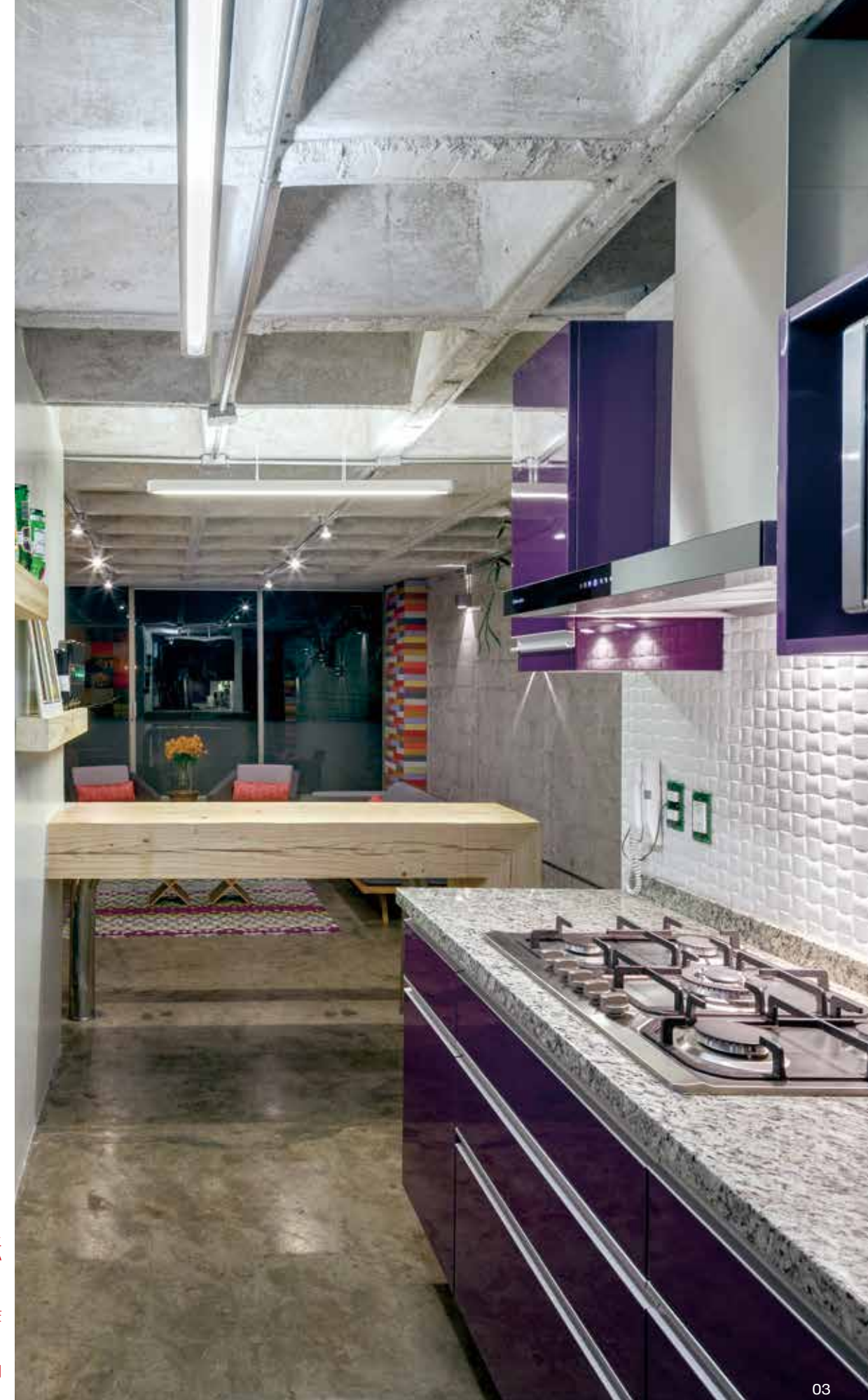
01. 早餐店風格的用餐角落，五顏六色的牆面與深具存在感的土耳其藍沙發也創造出了一種奇妙的視覺平衡感。 02. 裸露的混凝土天花板與牆面，成了揮灑空間色彩的最佳畫布。 03. 從廚房、吧台延伸到起居空間，雖然沒有隔間卻明確的規劃出空間使用機能。