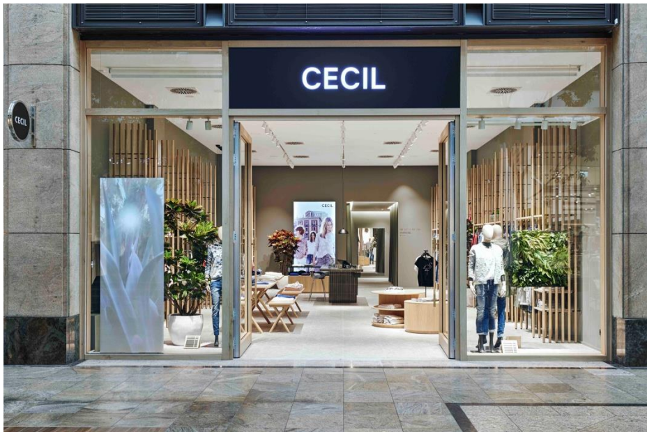
Motiv 5

Wandfliesenserie Craft von Agrob Buchtal: Hochglänzende Glasuren mit beeindruckender optischer Tiefe und urwüchsig-archaischem Charakter. Kombiniert mit einer besonderen Formensprache basierend auf klassischem Riemchenformat.