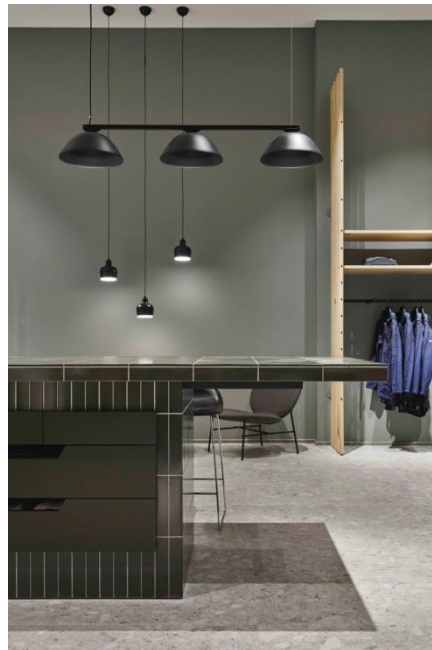
Motiv 2 und 3

Zentrales Element im richtungsweisenden Verkaufsraum der Zukunft: Der Kommunikationstisch.