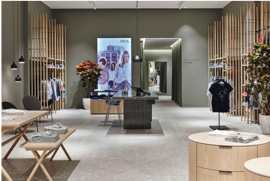
Motiv 1

Harmonisch, einladend, frisch: Das Retail Laboratory von Cecil in Oberhausen mit naturbelassenem Eichenholz, einem warmen Grünton, echten Pflanzen und aktuellen Kampagnenbildern.