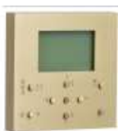
Commande de climatisation Daikin

Quelques exemples de réalisations sur-mesure :