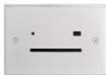
Lecteur / programmeur Smart Card (Vimar - Eikon)