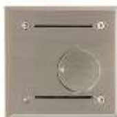
Thermostat (Feller) modèle Suisse