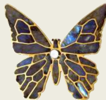
▲ Bronze serti de labradorite

Pouvoir répondre aux demandes les plus extravagantes fait la renommée de la marque.