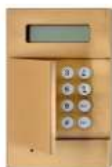
Habillage clavier alarme + porte