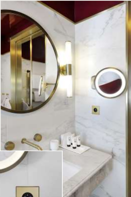
Le Grand Powers à Paris