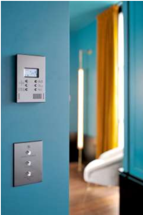
Le Roch Hôtel & Spa à Paris