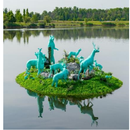
(1) Cube spatial , Marie-Eve Martel (arrondissement Québec 2018) ©Stéphane Bourgeois_EXMURO (2) Quand les avions en papier ne partent plus au vent (Montréal 2021) ©EXMURO (3) Les heureux naufragés , Demers-Mesnard, (Longueuil 2019) ©Seminaro.

Chaque année, des œuvres d'art public étonnantes et singulières, issues du parcours PASSAGES INSOLITES à Québec, voyagent dans d'autres villes, au Canada et dans le monde. Imaginées par des artistes en art actuel de Québec et d'ailleurs, ces installations réinventent l'expérience urbaine en posant un regard nouveau sur les lieux qu'elles habitent. PASSAGES INSOLITES provoque l'imaginaire en invitant à la découverte d'installations hors du commun qui transforment votre expérience de la ville.