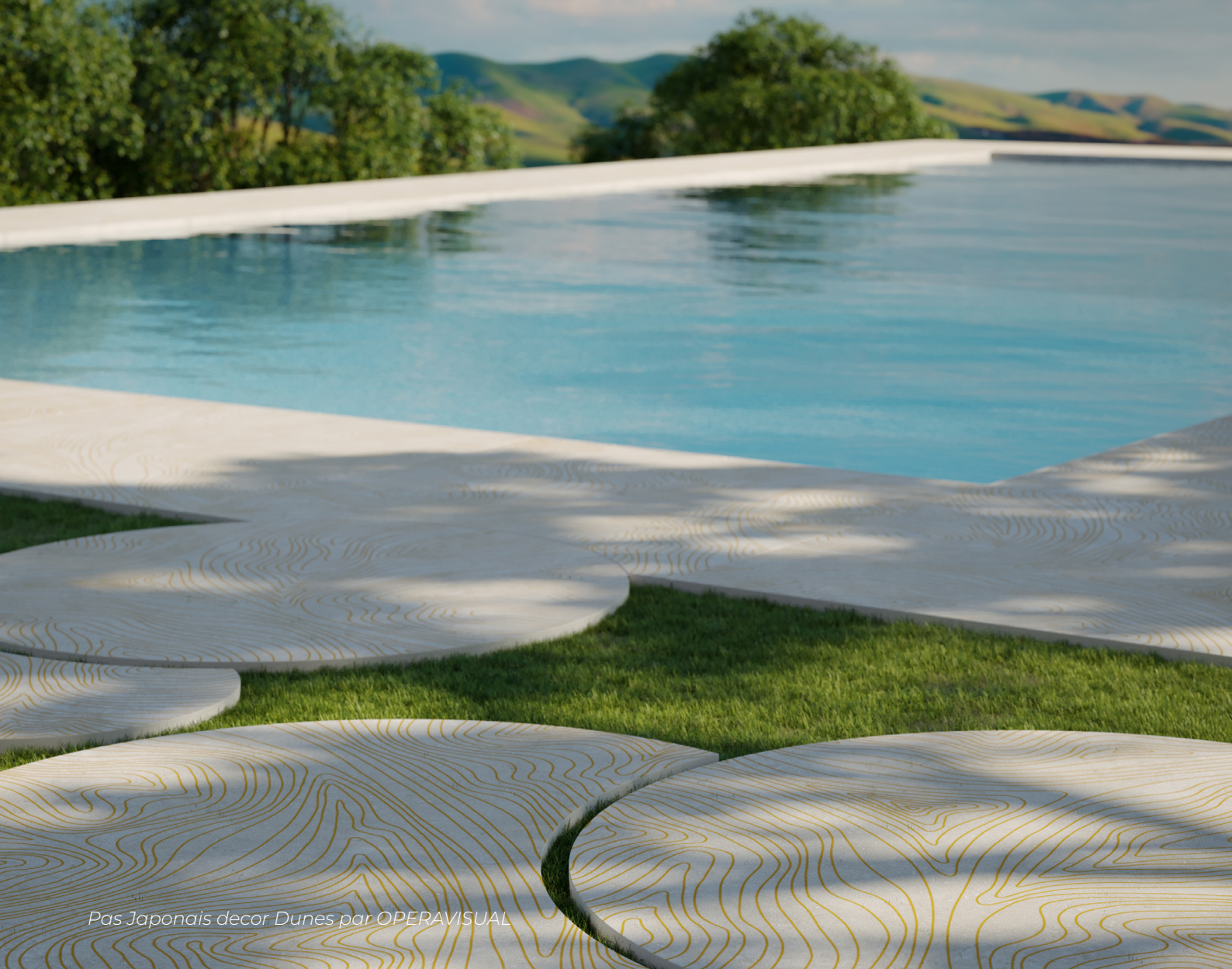
Pas Japonais décor Dunes par OPERAVISUAL