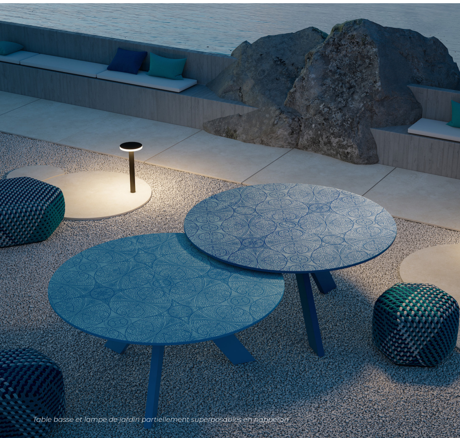
Table basse et lampe de jardin partiellement superposables en napperon

Une invitation à parcourir la Méditerranée avec cinq motifs différents qui parcourent une gamme complète de listes de meubles modulaires et inter-compatibles, pour de nombreuses combinaisons possibles mais toujours cohérentes et coordonnées.