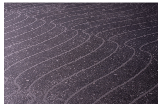
De gauche à droite : Dunes d'OPERA VISUAL, Dionysos de LATOxLATO et Wave de Pier Luca Freschi.