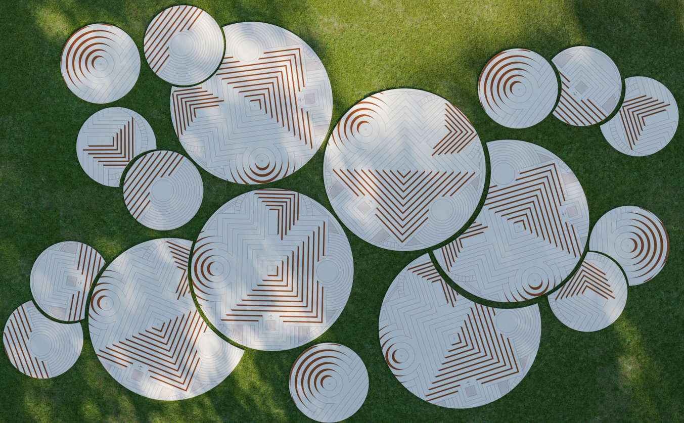
Pas Japonais décor Dionysos, tapis Rug' Stone Decor composition de 18 éléments