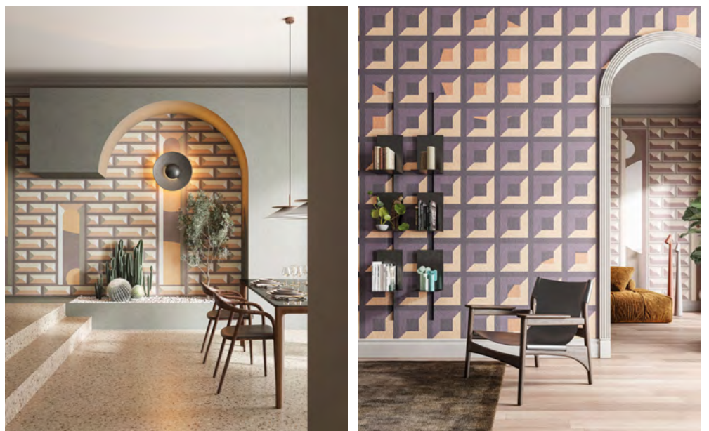
BOSSAGE e COFFER MANIA by LATOxLATO

GIUGNO 2023 - LATOxLATO esordisce nella progettazione di carte da parati collaborando per la prima volta con Inkiostro Bianco , marchio italiano specializzato in rivestimenti decorativi fra arte, architettura e design. Il risultato è una serie di suggestivi wallpaper metafisici. Visioni urbane che avvolgono gli spazi in una dimensione rarefatta, onirica e al tempo stesso in movimento.