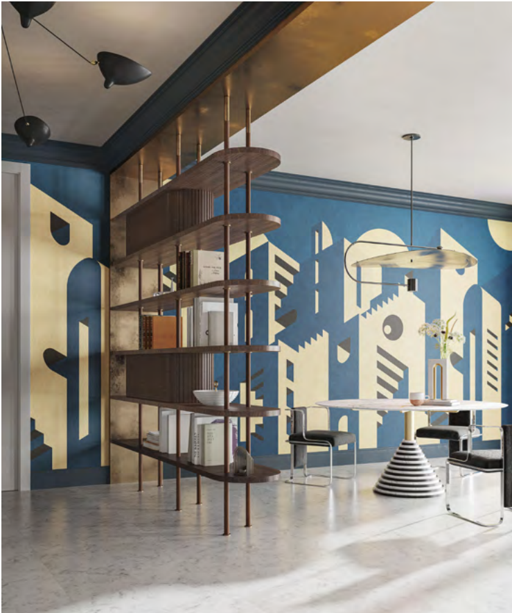
METROPOLIS by LATOxLATO

GIUGNO 2023 - LATOxLATO esordisce nella progettazione di carte da parati collaborando per la prima volta con Inkiostro Bianco , marchio italiano specializzato in rivestimenti decorativi fra arte, architettura e design. Il risultato è una serie di suggestivi wallpaper metafisici. Visioni urbane che avvolgono gli spazi in una dimensione rarefatta, onirica e al tempo stesso in movimento.