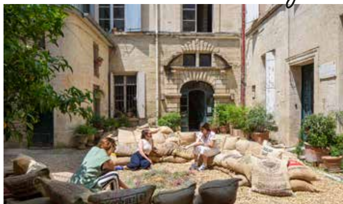
2025 : L'après des déchets (IAAC)

ReCITYing, projet cofondé par le programme Europe de l'Union Européenne, vise à créer une plateforme de réseau et d'échange sur les pratiques de réutilisation temporaire des espaces urbains. Destiné aux jeunes créatifs, professionnels de l'architecture, du design et des arts, ainsi qu'aux décideurs politiques et entreprises sociales locales, ce projet promeut la régénération d'espaces et de bâtiments urbains inutilisés en laboratoires artistiques et incubateurs culturels.