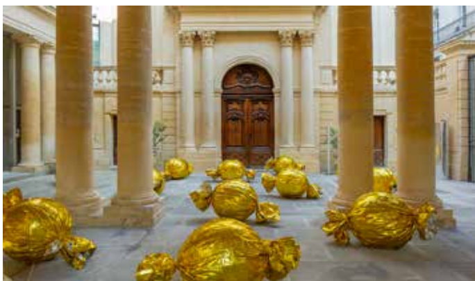
2025 : Portrait d'une planète (UNIGE)